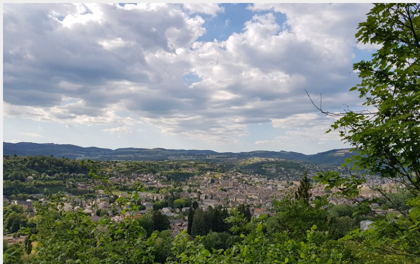
Vue de Marvejols