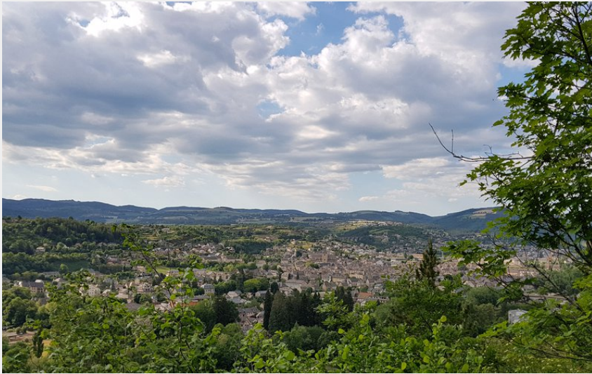
Vue de Marvejols (OTCCGD)