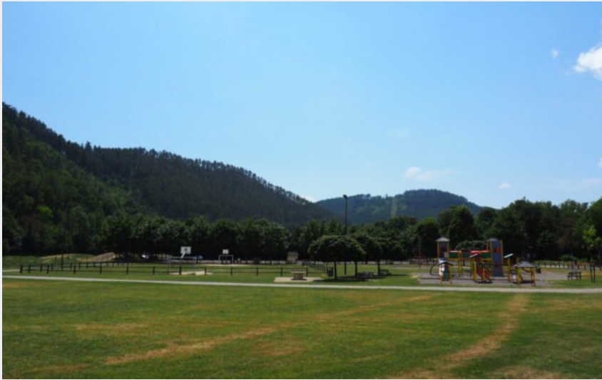
Le lieu de départ du circuit (Office de Tourisme Gévaudan Destination)