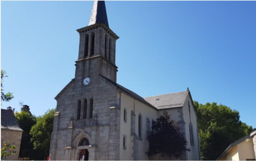
L'église de Saint-Laurent-de-Muret (Office de Tourisme Gévaudan Destination)