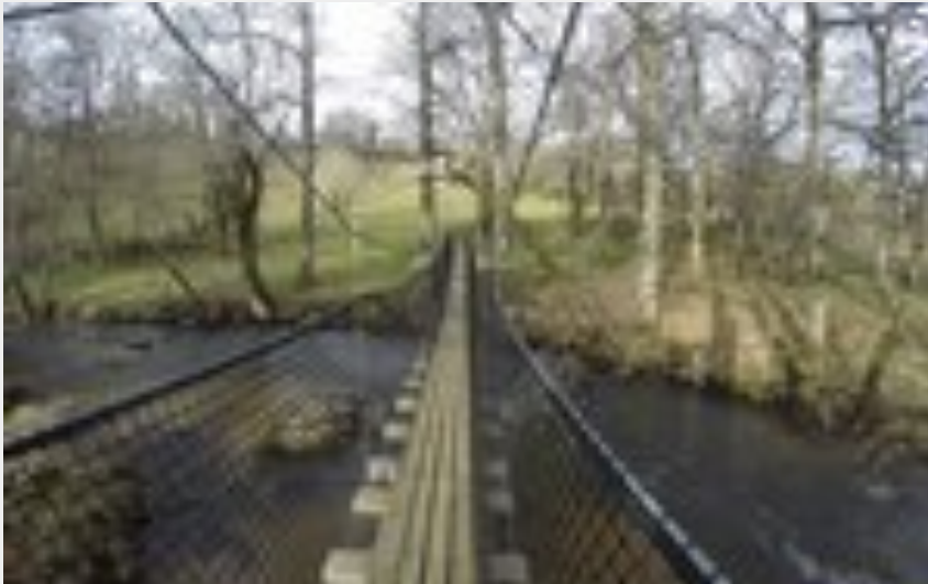
Parcours le long de la rivière