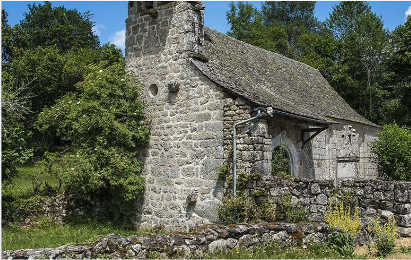
La Chapelle de Mels (A. Mérvilles)