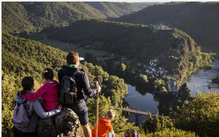
GR736 - Presqu'île d'Ambialet (CDT du Tarn)