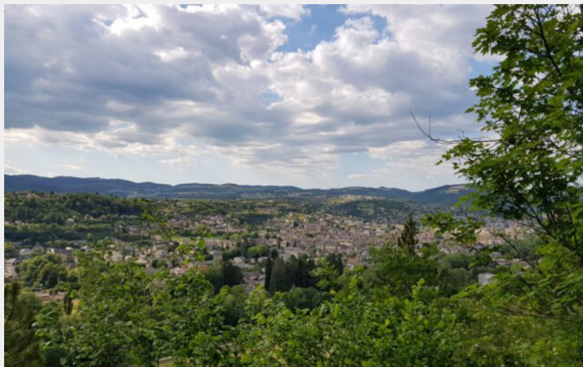
Vue sur la vallée de la Colagne et de Marvejols