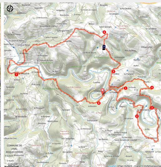
VTT Combret

Technicité requise sur cette grande boucle qui serpente entre sentiers forestiers et lignes de crête et qui vous emmène au monastère Notre-Dame d'Orient au gré d'un jeu de piste patrimonial