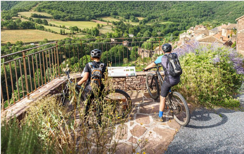
VTT Combret