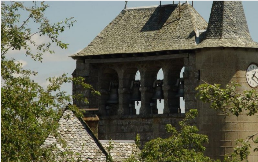
L'église dans le bourg de Lieutadès (OT des Pays de Saint-Flour)