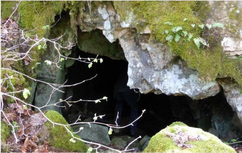
(OT des Pays de Saint-Flour)