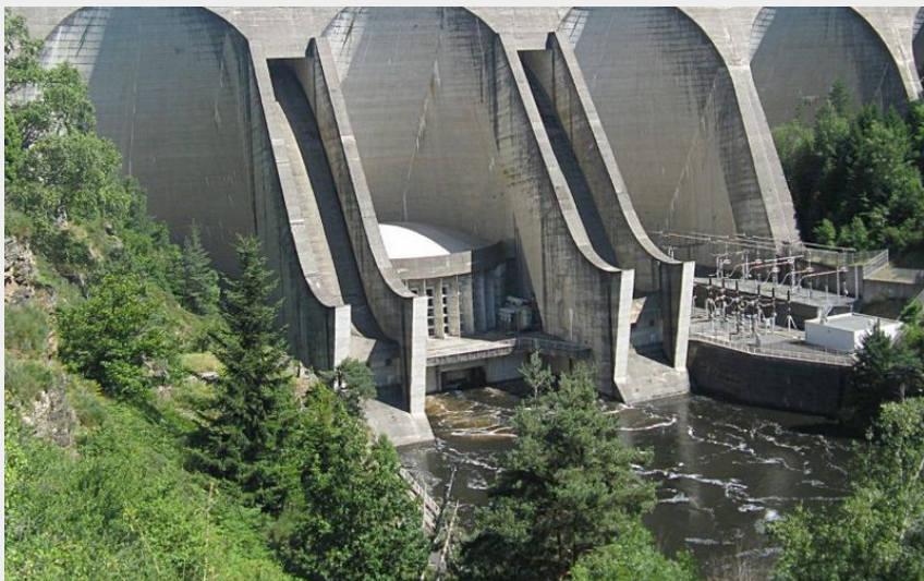
Le barrage de Grandval