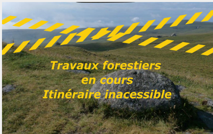
IMPRATICABLE, travaux forestiers en cours