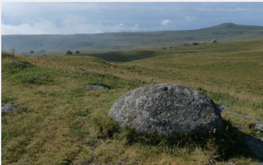
Vue sur les estives depuis la Quille des Goutals