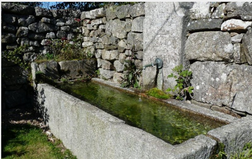
Abreuvoir sur le chemin (OT des Pays de Saint-Flour)