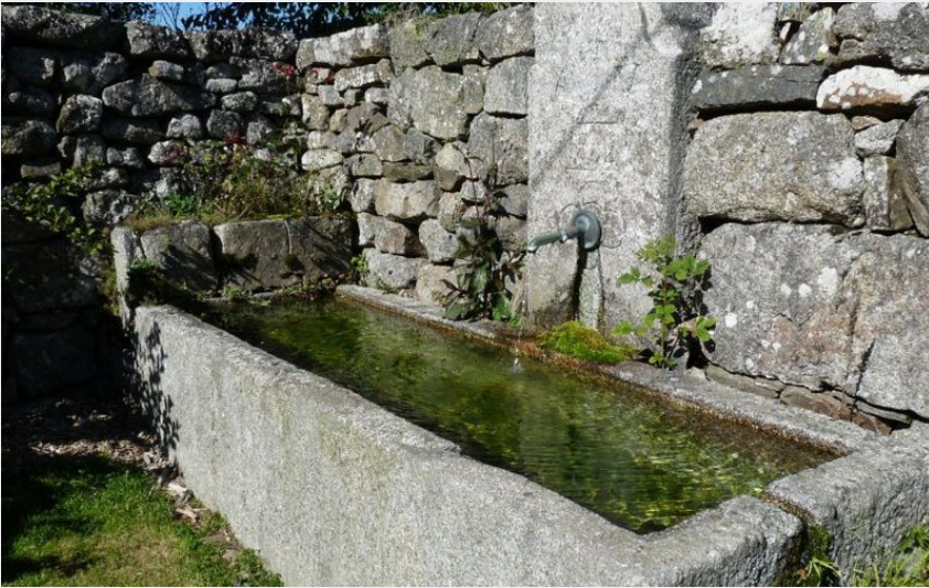
Abreuvoir sur le chemin (OT des Pays de Saint-Flour)