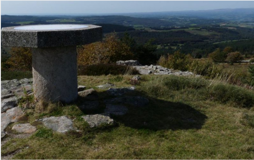
La table d'orientation au point culminant de la randonnée