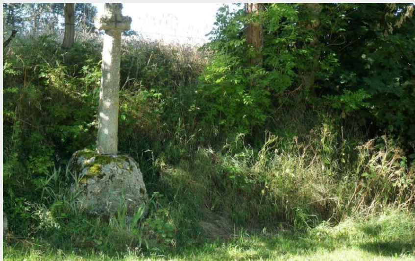
Une des nombreuses croix qui ponctuent le parcours (OT des Pays de Saint-Flour)