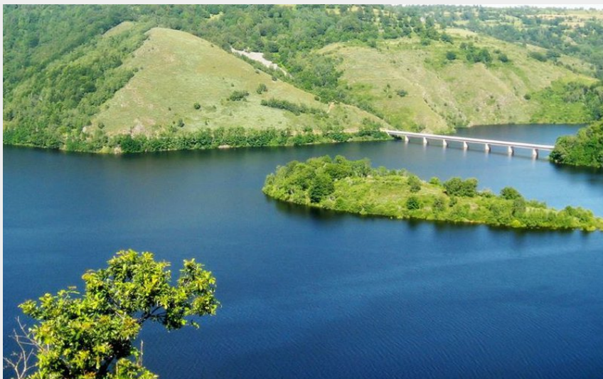
Vue depuis le belvédère sur le pont de Mallet