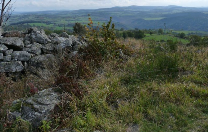
Vue depuis le Mont Mournac sur la vallée du Lévandès (OT des Pays de Saint-Flour)