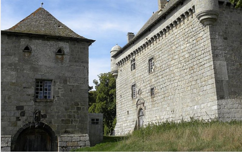
Vue sur château de Montvallat (OT des Pays de Saint-Flour)