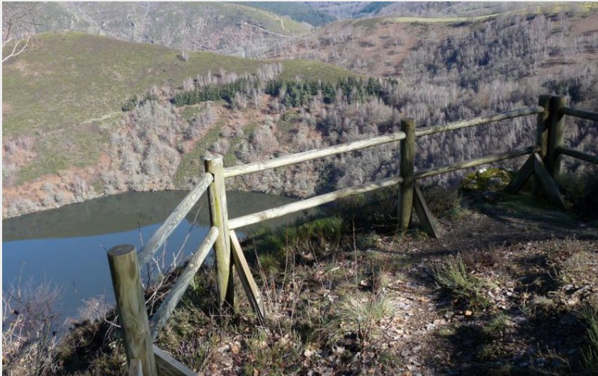
Une belle vue sur le lac de barrage depuis un chemin en balcon