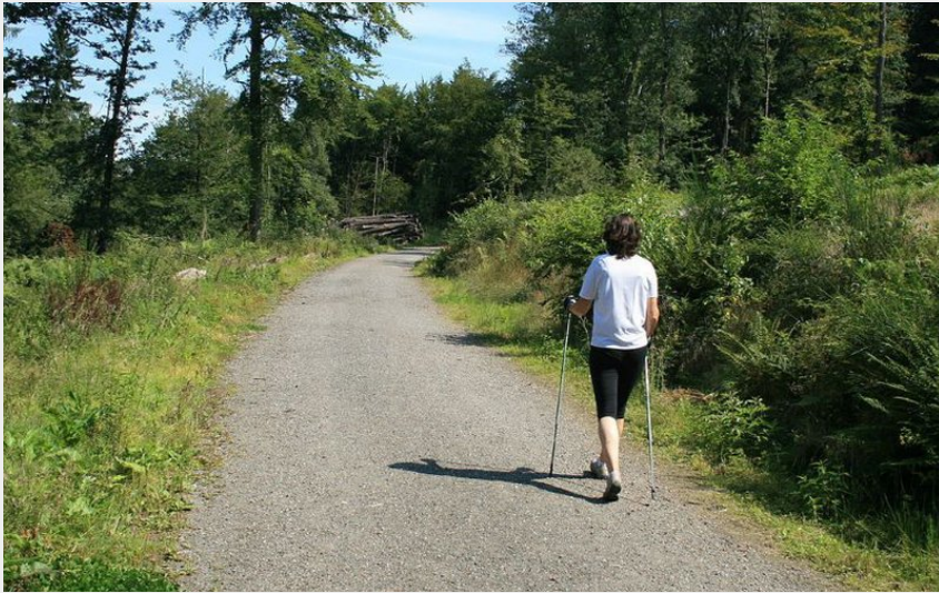
Les chemins forestiers pour accéder à la vallée du Bès (OT des Pays de Saint-Flour)