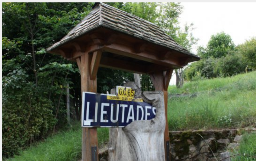
La panneau du village absorbé par un arbre