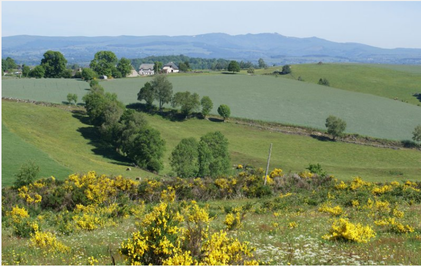
Vue sur les contreforts de l'Aubrac