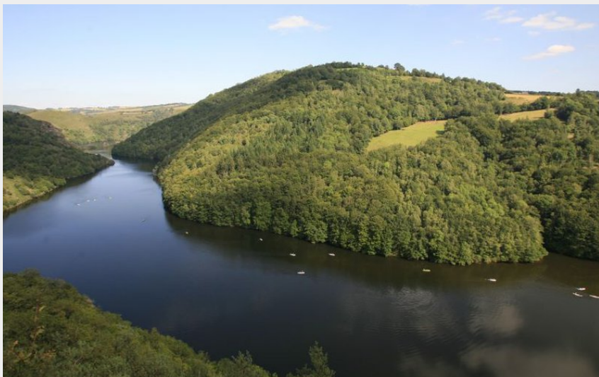
De nombreux canoës sur la Truyère (OT des Pays de Saint-Flour)