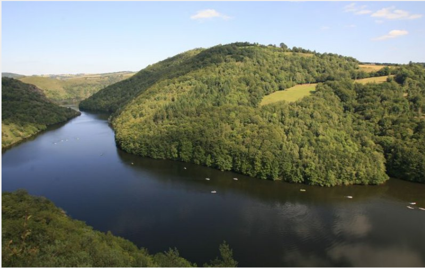
De nombreux canoës sur la Truyère