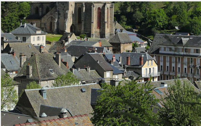
L'écrin du village de Chaudes-Aigues