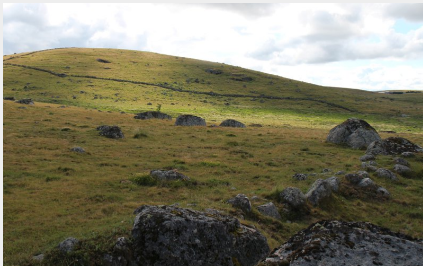
Plateau de l'Aubrac