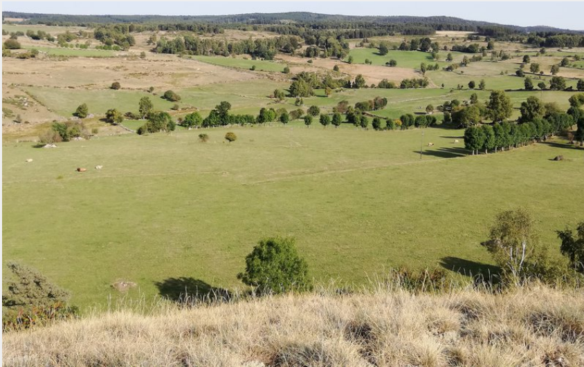
Vu du Rocher du Cheylaret