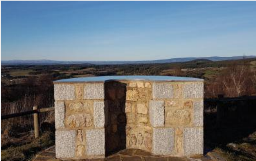
Point de vue Termes (Raymonde Joubert)