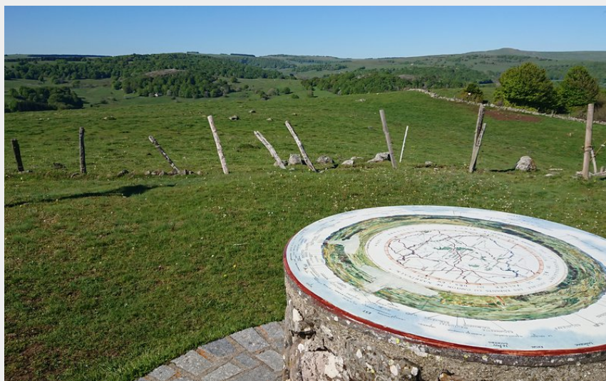
Table d'orientation au sommet