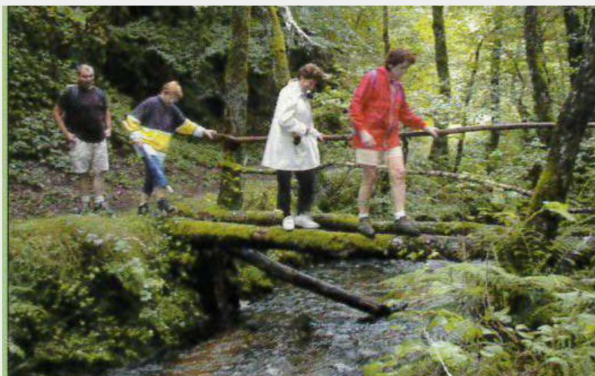
(Randonneurs sur une passerelle)