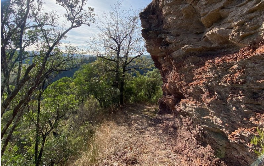
Falaises de Luz (E.Genty)