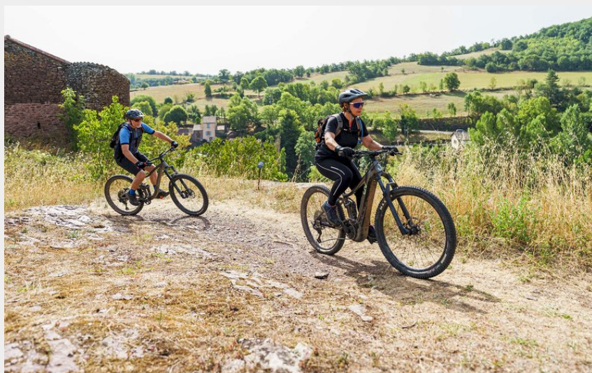
VTT Combret haut du village