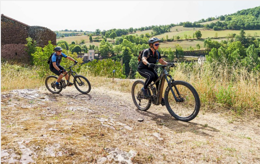
VTT Combret haut du village

Des falaises de Roquefort au Rougier - Combret