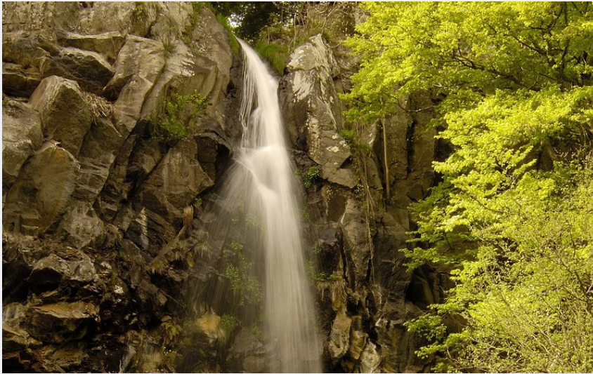
Cascade du Devez