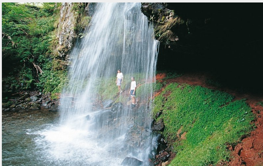
La Cascade du Capat avant Malbo (OT Pierrefort)