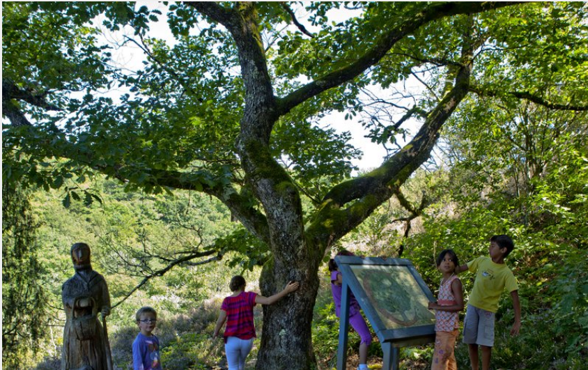
Sculptures et apprentissage sous un arbre