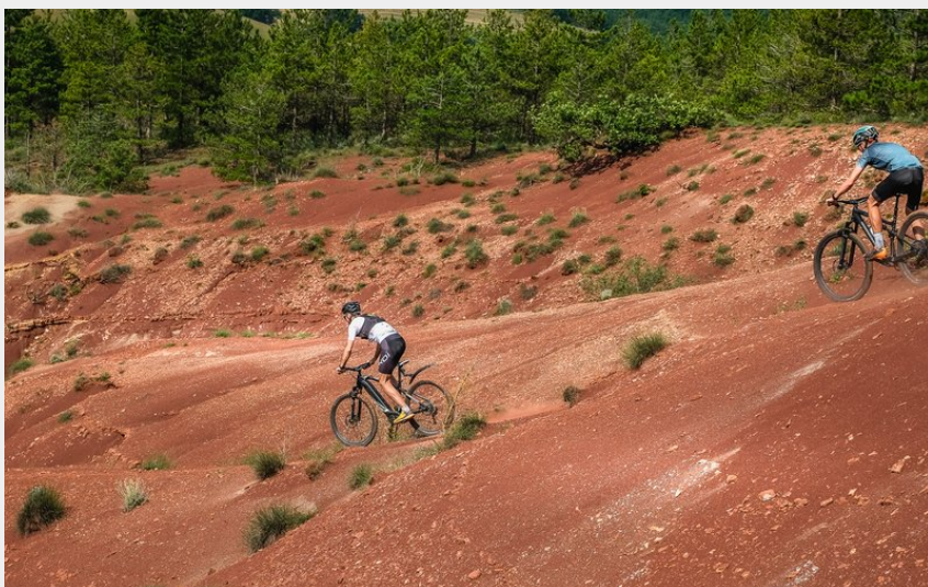
Au cœur du Rougier (V.Govignon)