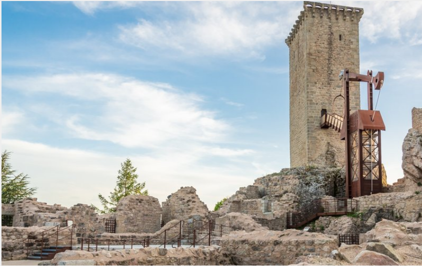
La Tour d'Apcher (Ludo Visuel)