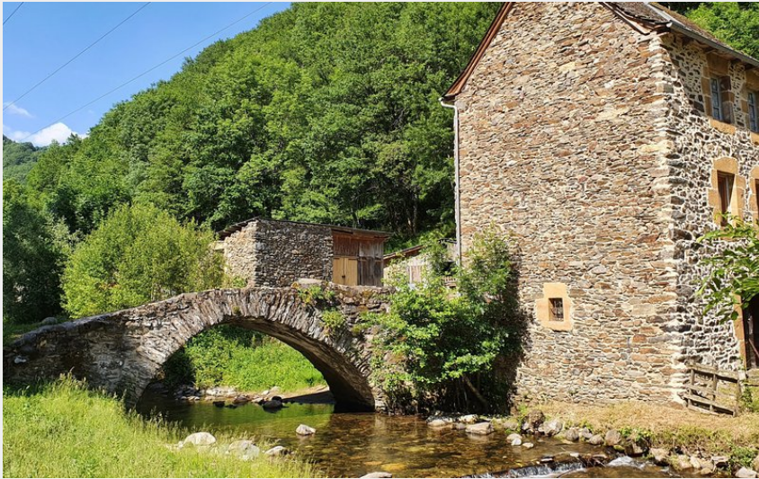
Les Pessoles (Office de Tourisme des Causses à l'Aubrac)