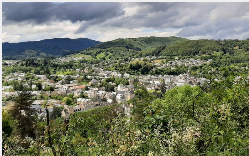
Vue sur la randonnée des Vaysseries