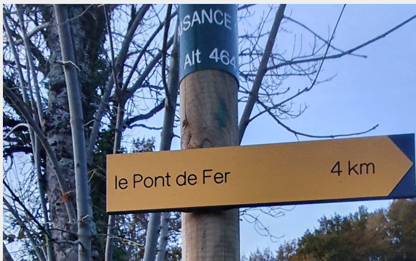
Le Pont de Fer