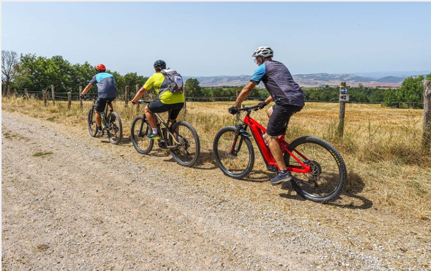
VTT Belmont-Montlaur

Des falaises de Roquefort au Rougier - Belmont-sur-Rance