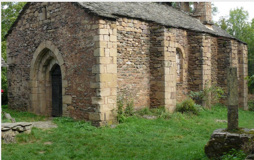
La Chapelle d'Aurelle (Office de Tourisme des Causses à l'Aubrac)