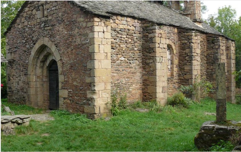
La Chapelle d'Aurelle (Office de Tourisme des Causses à l'Aubrac)