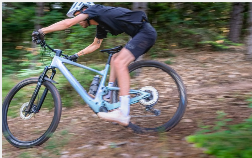
Pistes du Maliver (V.Govignon)