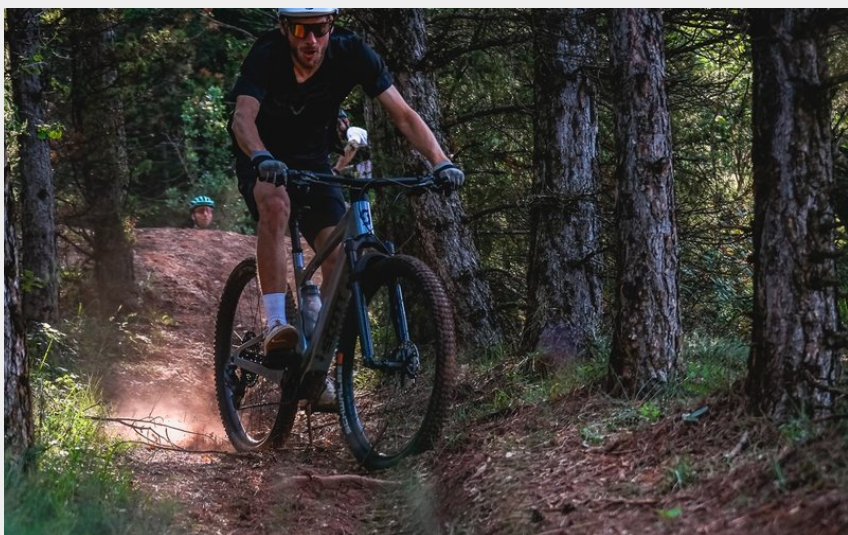
La forêt de St Thomas (V.Govignon)